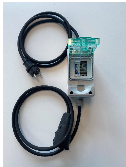
Komplett enhet 1,5 m kabel på var sida.